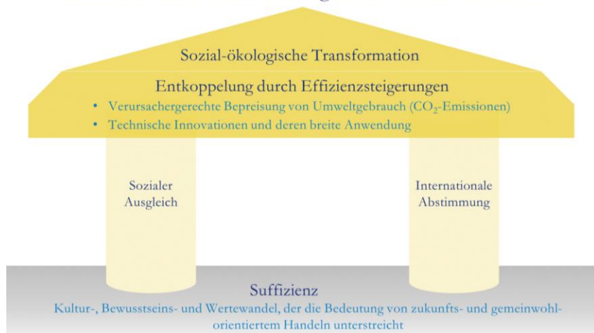
Abbildung 2: Leitplanken einer sozial-ökologischen Transformation von Wirtschaft und Gesellschaft

2. Diese Strukturreformen sind mit beachtlichen Verteilungseffekten und entsprechenden Interessenskonflikten verbunden. Sie benötigen daher als tragende Pfeiler einen angemessenen sozialen Ausgleich und eine wirksame internationale Abstimmung. Nur so ist es möglich, den notwendigen breiten Konsens in der Bevölkerung zu erzielen und sich erfolgreich gegen „Trittbrettfahrer“ zu schützen, die sich mit geringeren Umwelt- und Sozialstandards Vorteile im Wettbewerb verschaffen wollen.