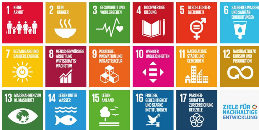
Abbildung 1: Die Globalen Nachhaltigkeitsziele (SDGs: Sustainable Development Goals)

weder gerechtfertigt ist, Wachstum als vorrangige wirtschaftspolitische Strategie zu verfolgen, noch es generell abzulehnen. Notwendig ist vielmehr eine sozial-ökologische Transformation von Wirtschaft und Gesellschaft.